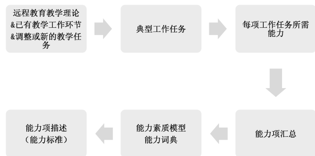
图1 能力标准研究思路

确定典型工作任务后,对每项工作任务进行分析,得出每项任务所需具备的能力;再将所有的能力项进行汇总,合并重复项,调整相似项,形成能力词典;对能力词典进行总结分类,形成能力素质模型;最后对每个能力项进行描述,形成能力标准,见图1。